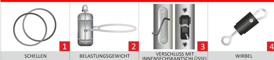
SCELLEN BELASTUNGSGEWICHT VERSCHLUSS MIT INNENSECHSKANTSCHLÜSSEL WIRBEL