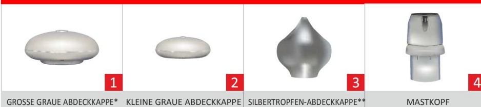
GROSSE GRAUE ABDECKKAPPE* KLEINE GRAUE ABDECKKAPPE SILBERTROPFEN-ABDECKKAPPE** MASTKOPF