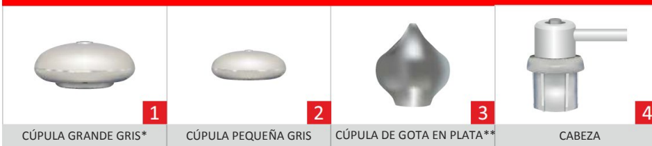
CÚPULA GRANDE GRIS*