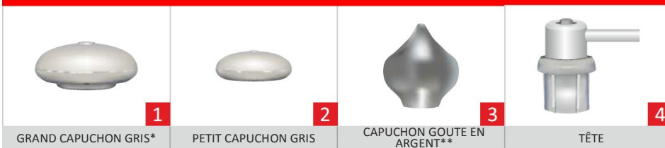
GRAND CAPUCHON GRIS*