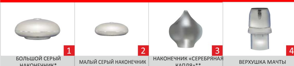
БОЛЬШОЙ СЕРЫЙ НАКОНЕЧНИК*