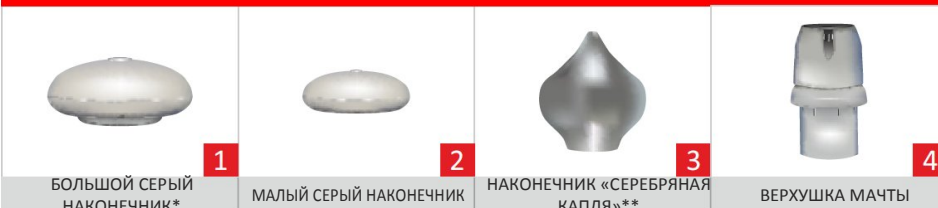
БОЛЬШОЙ СЕРЫЙ НАКОНЕЧНИК*