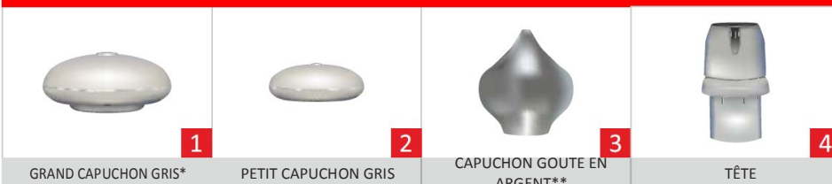
1 GRAND CAPUCHON GRIS*