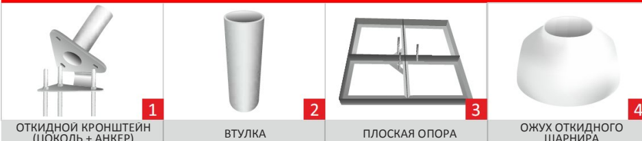
ОТКИДНОЙ КРОНШТЕЙН (ЦОКОЛЬ + АНКЕР)