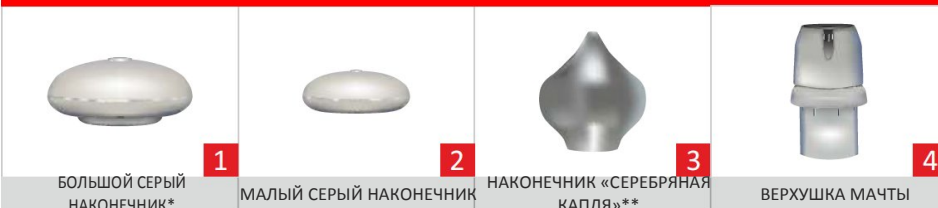
БОЛЬШОЙ СЕРЫЙ НАКОНЕЧНИК*