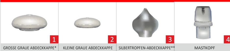
GROSSE GRAUE ABDECKKAPPE* KLEINE GRAUE ABDECKKAPPE SILBERTROPFEN-ABDECKKAPPE** MASTKOPF