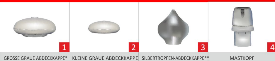
GROSSE GRAUE ABDECKKAPPE* KLEINE GRAUE ABDECKKAPPE SILBERTROPFEN-ABDECKKAPPE** MASTKOPF *erhältlich auch in silbern und golden **erhältlich auch in weiß und golden