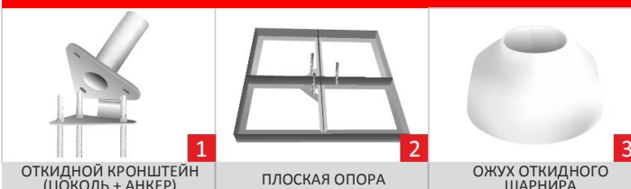
ОТКИДНОЙ КРОНШТЕЙН (ЦОКОЛЬ + АНКЕР)