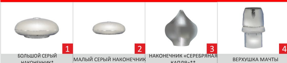
БОЛЬШОЙ СЕРЫЙ НАКОНЕЧНИК*