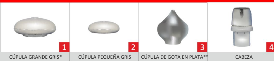
CÚPULA GRANDE GRIS*