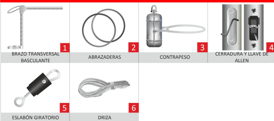
BRAZO TRANSVERSAL BASCULANTE