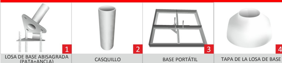
LOSA DE BASE ABISAGRADA (PATA+ANCLA)