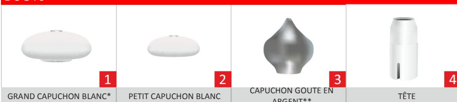
GRAND CAPUCHON BLANC*