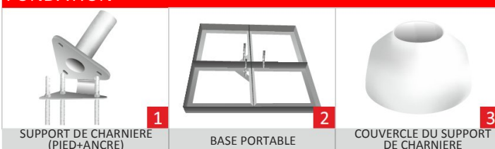
SUPPORT DE CHARNIERE (PIED+ANCRE)