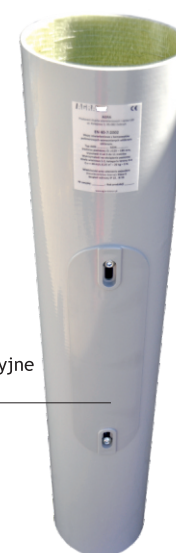
Drzwiczki rewizyjne (PC + ABS)

Rozwiązanie umożliwia prowadzenie prac konserwacyjno-serwisowych bez dodatkowych narzędzi z poziomu gruntu.